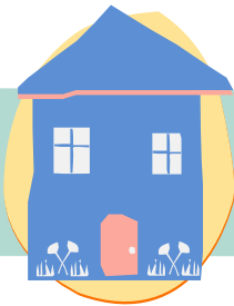
العودة إلى المنزل