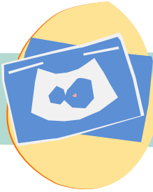
التصوير المقطعي الثاني