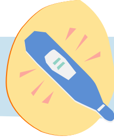
اكتشفي أنك حامل