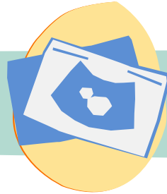
التصوير المقطعي الأول