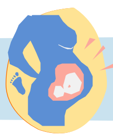
الشعور بحركة طفلك